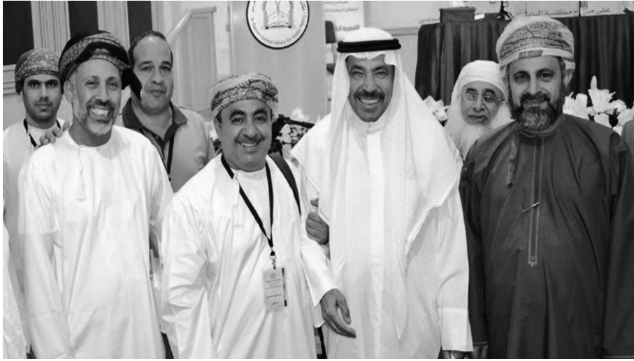
عبدالعزیز الباطین مع بعض محبيه في سلطنة عمان

في سلطنة عمان تبكي الحروف على فراق عبدالعزیز الباطین، فيرثيه رئيس مجلس الخليلي للشعر محمد بن عبدالله الخليلي قائلاً: «لقد وافت المنية عبدالعزیز الباطین بعد رحلة عطاء ثقافية وإنسانية تاركاً ذكراه ومحبه خالدة في القلوب».